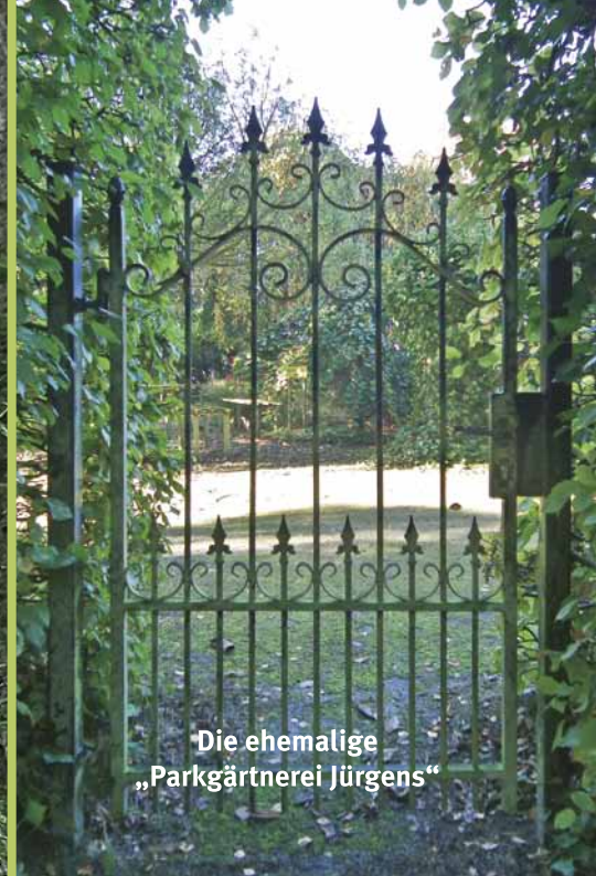
Die ehemalige „Parkgärtnerei Jürgens“